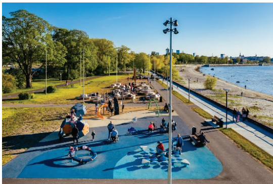
Foto 2: Reidi tee äärne promenaad Pirita Linnaosa ja Tallinna kesklinna vahel. 2