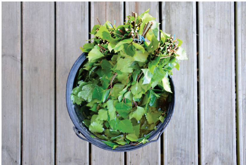
Foto 1: Sauna lahutamatu osa on vihtlemine – saunavihad on leos ja valmis vihtlemiseks

vanast vihast enne tulehakatiseks saatmist leivaahju luud. Õeldi, et naised, kes leivaahju luuda teha ei oska, ei saa mehele.