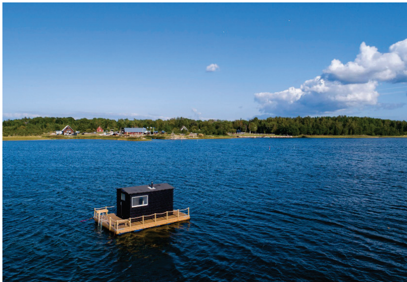
Foto 5: Muhu saarel, Bottengarni külalistemajas saab sauna nautida keset vett

Muhu saarel romantilises Koguva kalurikülas ootab sootuks isemoodi saunaelamus. Seal on võimalik saunatada otse keset merd. Bottengarni külalistemajas saab ööbida ujumajas, mille juurde kuulub ka õhtune saunatamine keset merd asuvas ujussaunas. (vt foto 5)