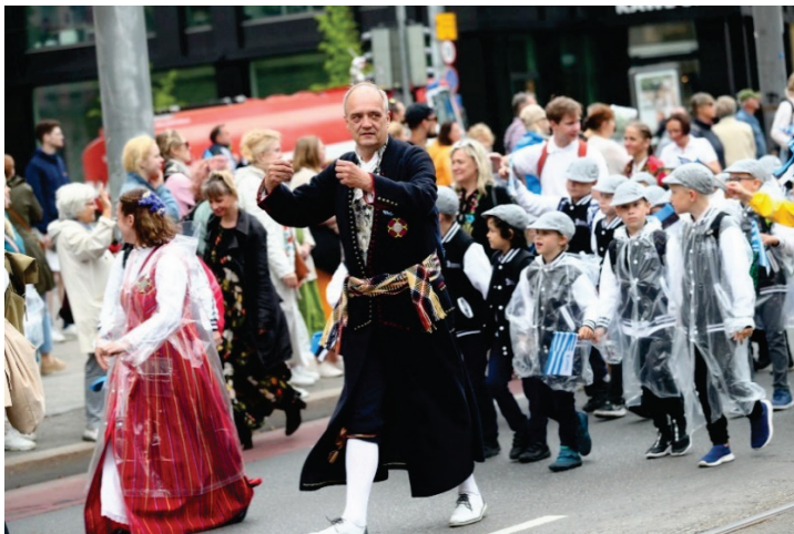
Foto 5: Noorte laulu- ja tantsupeo „Püha on maa“ rongkäik kesklinnast lauluväljakuni (algus kesklinnas)./ Jugendlied- und Tanzparty „Pyha on maa“ Prozession vom Stadtzentrum zum Liederplatz (Beginnen Sie im Stadtzentrum)/ Youth song and dance party "Pyha on maa" procession from the city center to the song square (start in the city center).