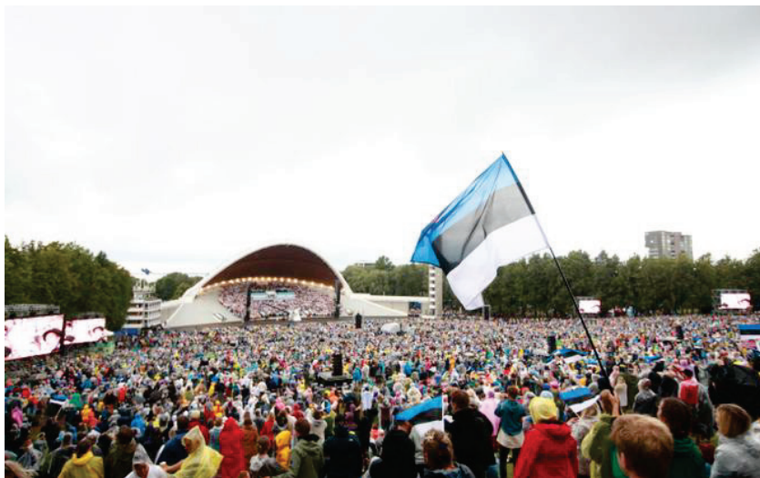
Foto 2: Lõpuühendkooris oli 326 koori ja 10 700 lauljat/ 326 Chöre und 10.700 Sänger im endgültigen Gesamtchor/ 326 choirs and 10,700 singers in the final combined choir. [ https://i.err.ee/smartcrop?type=optimize&width=672&aspectratio=16%3A10&url=https%3A%2F%2Fs.err.ee%2Fphoto%2F023%2F07%2F02%2F1983224h8bdb.jpg ] 6.07.2023

90,000 people visited the XIII Youth Song and Dance Festival, where 31,415 singers, dancers and instrumentalists performed. 778 collectives, 23,139 choir singers and orchestra players participated in the 13th Youth Song Festival at the Tallinn Song Festival Grounds. Choirs and orchestras were supervised by 657 conductors. 362 choirs and 11,900 singers sang in the opening joint choir and 326 choirs and 10,700 singers in the closing joint choir.