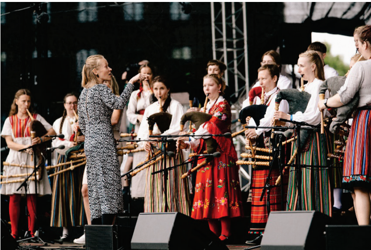
Foto 4. Rahvamuusikapeol osales kokku rohkem kui 830 pillimängijat ja 83 kollektiivi ning üles astus seitse erinevat pillikoori/ Insgesamt nahmen mehr als 830 Instrumentalisten und 83 Kollektive am Volksmusikfestival teil und sieben verschiedene Instrumentenchöre traten auf/ A total of more than 830 instrument players and 83 collectives participated in the folk music festival, and seven different instrument choirs performed. [ https://s.err.ee/photo/crop/2023/07/01/1979945he5d0t27.jpg ] 6.07.2023