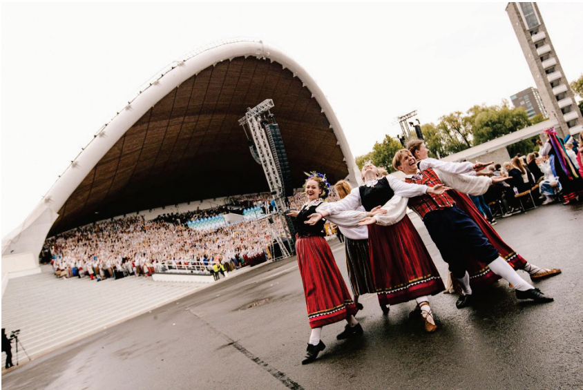
Foto 1: Tantsuansambel Lee tantsijad tulid laulupeol "Sata-sata" laulu ajal laulukaare ette tantsima/ Die Tänzer des Tanzensembles Lee kamen während des Liedes „Sata-sata“ auf der Liederparty zum Tanzen vor dem Gesangsbogen/

30.06-2.07.2023 toimus Tallinnas Eesti XIII noorte laulu- ja tantsupidu „Püha on maa“! 30.06.-2.07.2023 – die estnische XIII. Jugendlied- und Tanzfestival fand in Tallinn statt! 30.06-2.07.2023 – the XIII Estonian Youth Singing and Dance Festival took place in Tallinn!