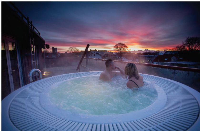
Foto 4: Johan Spa privaatasauna juurde kuulub ka katusel olev mullivann

Spaapuhkus on üks lihtsaim viis saunaelamuse saamiseks. Klassikalise Soome sauna ja aurusauna kõrval on Saaremaa spaades mitmeid huvitavaid variante. Näiteks pakub Grand Rose SPA saunakeskus kadakasauna, mis on 60 kraadine ja suure õhuniiskusega kadaka aroomidega saun. Tõeliselt saaremaine! Georg Ots SPA ootab tõelisi saunasõpru leilisauna "Sven". See 80-kraadine Soome saun on mõeldud neile, kes eelistavad saunas olla ilma riieteta, nii nagu vanad skandinaavlastel seda kunagi tegid. Mitmes spaas saab soovi korral rentida privaatasauna. Kui Arensburg Boutique Hotel & Spa , Asa spa privaatasaunad asuvad spaakompleksi lähedal, siis Johan Spa on enda privaatasauna viinud hoopis hotelli katusele. Lisaks kuumale leilile saad seal nautida ka kõrget vaadet Kuressaare vanalinnale. (vt. foto 4)