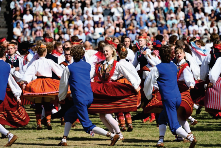
Foto 3: Noorte tantsupeo teine etendus / Der zweite Auftritt der Jugendtanzparty/ The second performance of the youth dance party. [ https://i.err.ee/resize?type=optimize&height=1080&url=https%3A%2F%2Fs.err.ee%2Fphoto%2Fcrop%2F2023%2F07%2F01%2F1980080haa1c.jpg ] 6.07.2023