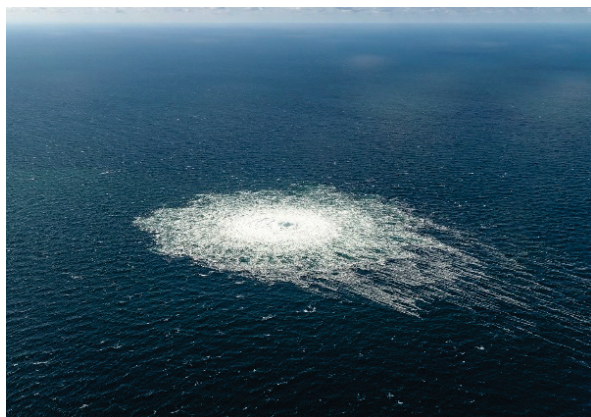
Foto: Nord Streami torudest väljuv metaan Läänemerele 27. septembril 2022. [ https://f9.pmo.ee/Bk-zHIMZEvDlj2uiK4k1s4hl1Nc=/1536x0/nginx/o/2023/04/06/15241828t1h3a2e.jpg ] 8.07.2023

Rootsi julgeolekuteenistus on algatanud Nord Streami torujuhtme intsidendi kohta juurdluse, nimetades seda jämedaks sabotaažiks, teatas agentuur kolmapäevases avalduses. Lisati, et ei saa välistada, et juhtunu taga on võõrvõim.