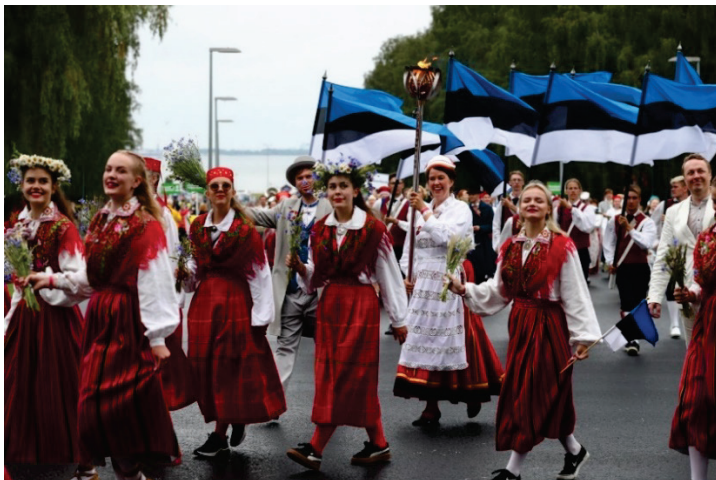
Foto 6: Noorte laulu- ja tantsupeo „Püha on maa“ rongkäik kesklinnast lauluväljakuni (5 km; esimesed peolised on jõudnud Lauluväljakule). / Jugendlied- und Tanz-party „Pyha on maa“ Prozession vom Stadtzentrum zum Liederplatz (5 km; Die ersten Party-gänger sind in Lauluväljak /in Liedfeld/ angekommen)/ Youth song and dance party "Pyha on maa" procession from the city center to the Tallinn Song Festival Grounds /the song square/ (5 km; the first partygoers have arrived at the Tallinn Song Festival Grounds / Song field/). https://i.err.ee/resize?type=optimize&height=1080&url=https%3A%2F%2Fs.err.ee%2Fphoto%2Fcrop%2F2023%2F07%2F02%2F1981265h0d27.jpg 6.07.2023