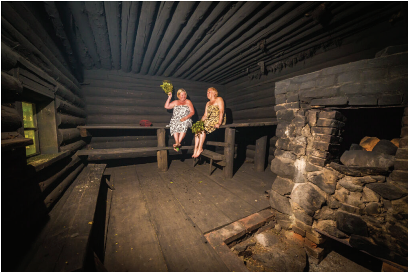
Foto 2: Sauna-aasta 2023. Hiiumaa. Suitsusauna leiliruum. [ https://support.google.com/legal/answer/3463239?hl=et ] 7.02.2023

Lisaks tavadest kinni pidamisele on tähtis ka tuju. Sauna tuleb minna heal meelel, ilma kurjade plaanideta. Saunamõnude kõrval on olulisel kohal omavaheline suhtlemine. Hiidlastel on ka täitsa oma uudisteagentuur – KKNSR, mis on lahti seletatult „keegi Kärkla naine saunas rääkis“. Sauna sisse minnes ikka teretati, öeldi: „Tere, sauna!“. Olid ka mitmesugused keelud, näiteks ei tohtinud saunas vilistada. Saunas pidi olema viisakas.